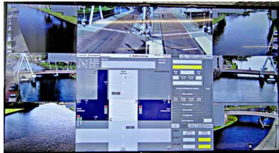
Terminal Stationsbrug Franeker

We waren nieuwsgierig of er nog voorkeur is voor de wijze van oproepen voor de brugbediening. Er is een lichte voorkeur voor marifoonoproep maar het maakt niet zo veel uit of het via de drukknop, app of marifoon binnenkomt. Maar hier moet wel een kanttekening bij gezet worden. Als je oproept, doe dat dan niet op hoog vermogen (25 Watt), wat zo wie zo is verboden, maar op laag vermogen (1 Watt). Je krijgt anders de attentie van alle brugwachters en dat is iets te