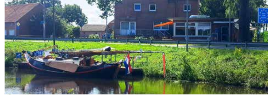
Op de grens

Daarna de boot gedraaid en terug naar Ter Apel. Zondagmorgen om 10 uur zou het konvooi van Ter Apel - Rütenbroek naar Haren (D) gaan varen. Helaas, brug kapot. Wij lagen precies op de grens voor het oude Duitse douanekantoor. Tot onze verbazing hing daar een flinke Friese wimpel aan de vlaggenmast. Wij op onderzoek uit en inderdaad, keurig restaurant met Friese eigenaren. Het laat zich raden. Heerlijk gegeten aldaar. De volgende dag om 10 uur met twee andere boten naar Haren gevaren. In de sluis van Haren vertelde een verder zeer ongeïnteresseerde sluiswachter dat we "geluk" hadden gehad. Weer een brug kapot en dat die dinsdagmiddag om 14.00 uur weer gerepareerd zal zijn.