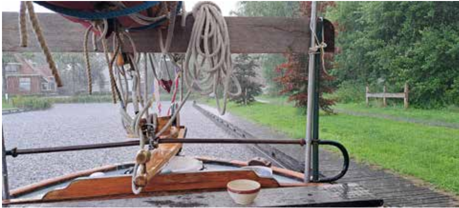
Gietregen in Annerveenschekanaal

Na twee dagen een konvooi opgepikt en samen met de blijmoedige gele hesjes, in de regen weer verder. In Bareveld afscheid genomen van onze "all weather" gele hesjes. Gelijk maar weer twee dagen blijven liggen. Boodschappen op de fiets in Veendam gehaald en uit eten bij de overbuurman. Dit is een truckersrestaurant waar elke dag minstens 50 vrachtwagens overnachten. Dan moet het eten wel goed zijn. En dat was ook zo.