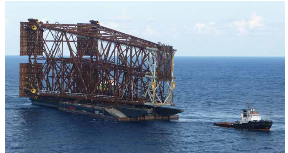
Materiaalbak met jacket

Op het uur van vertrek geen steeds geen WTK. Ik zag mezelf al Chinese wachten