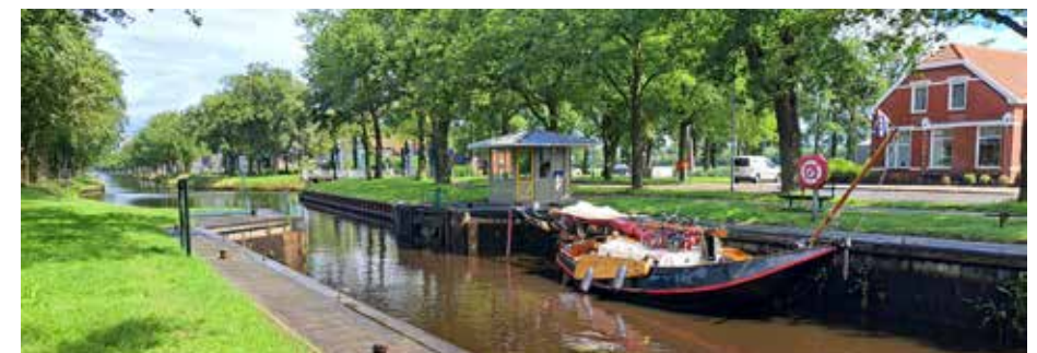
Een van de sluisen