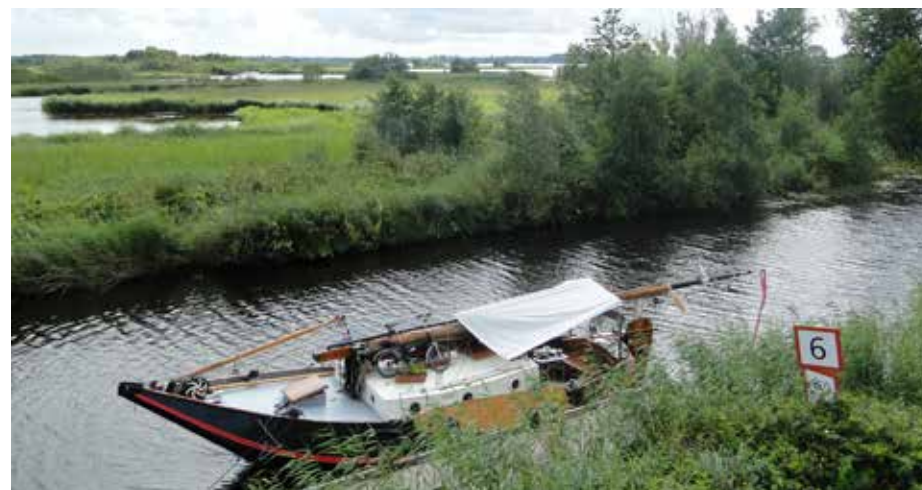
Op de uitzichttoren. De Leine nabij Zuidlaardermeer

Zo voelden we ons een beetje na ruim drie weken plensbuien met herfsttemperaturen. Maar laat ik met het begin beginnen. Na een fris voorjaar en een mooie junimaand lagen we half juli op ons mooie Schiermonnikoog. Maar de verwachtingen waren niet geweldig. We besloten dan maar om naar de wal te gaan, richting Groningen. Mijn broer(tje) woont daar aan het water en die heeft een douche, ontbijt en een wasmachine. Verder was er een leuke tentoonstelling over de Stones, leuke markten en andere musea. Kortom, we zouden ons daar niet vervelen.